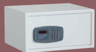
EDM 243 Lap

Maß- und Gewichtsabweichungen sowie technische Änderungen vorbehalten.