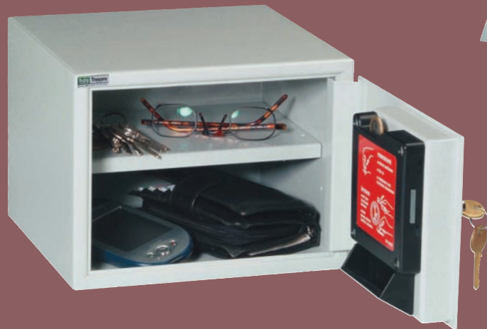
WG 2 MPS