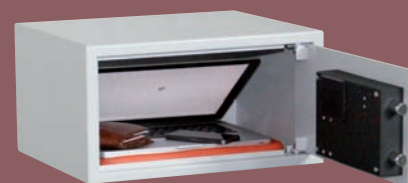
EDM 243 Lap